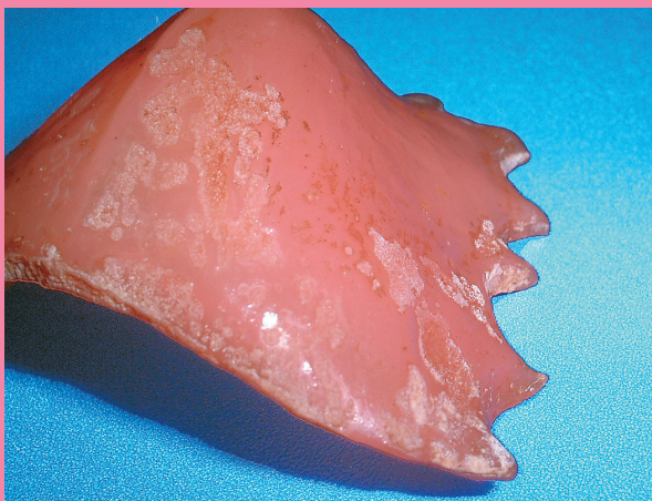
水洗いのみで3ヶ月間装着