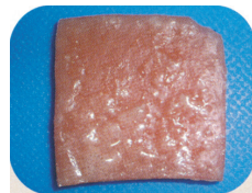
硬化直後より2週間浸漬