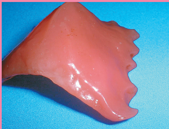
クリーンソフトを使用して3ヶ月間装着