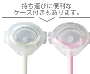
持ち運びに便利な ケース付きもあります。 携帯舌ブラシタングメイト (白/ピンク)