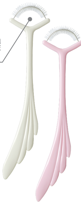
タングメイト -白/ピンク- (全長 12cm)